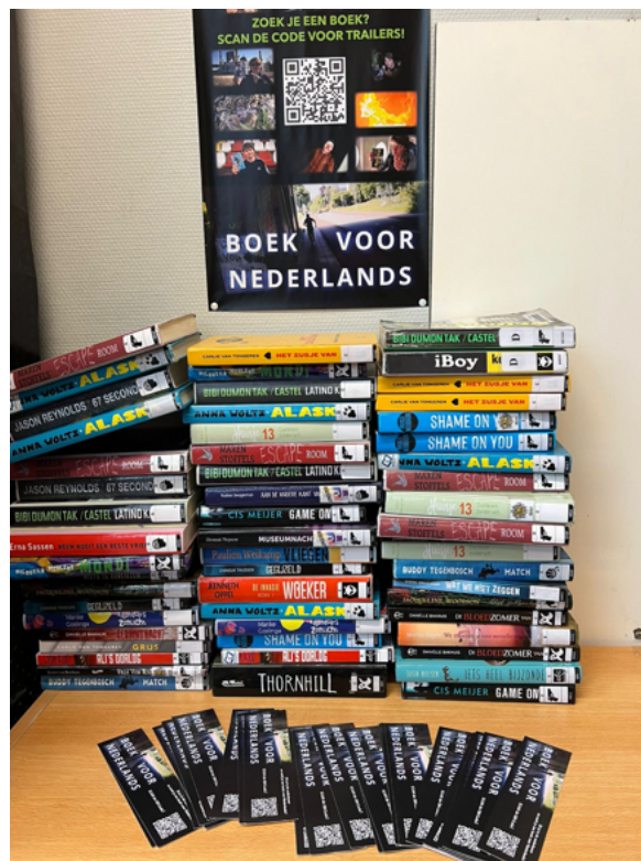
Boekenhoek op het Reggesteyn Nijverdal.